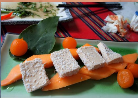
木瓜、蜜汁番茄、雪花糕