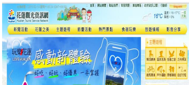
圖 15：花蓮觀光資訊網

將【Fighting! 巴奇達魯!】活動結合原住民族委員會、花蓮縣政府為活動報名窗口、發放文宣及 Facebook 粉絲專頁張貼相關活動訊息。