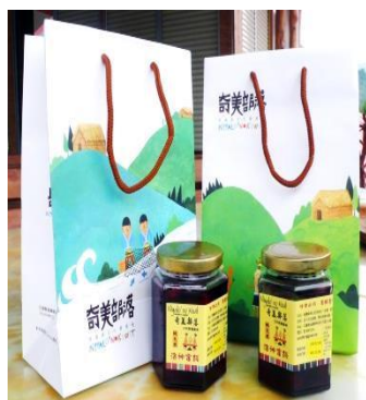
圖 11：奇美部落洛神蜜餞