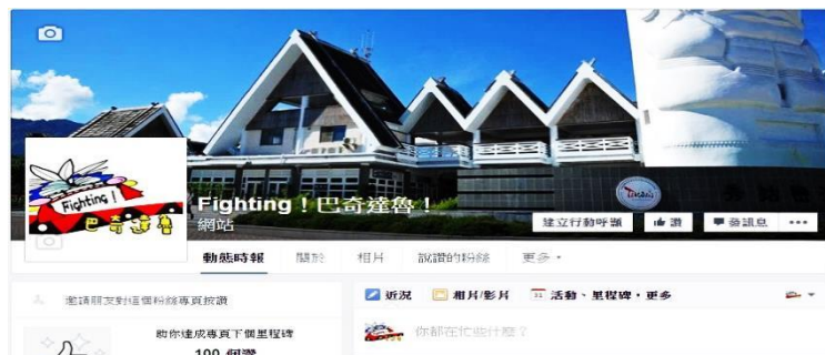
圖 9：Fighting! 巴奇達魯! Facebook 粉絲團