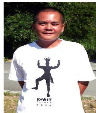
圖 12：奇美精神 T-Shirt