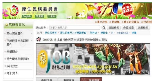
圖 16：原住民族委員會