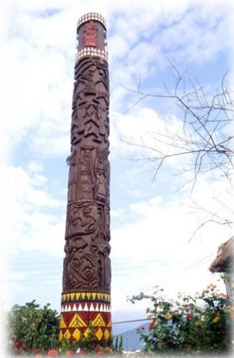
太巴塿發祥地紀念碑