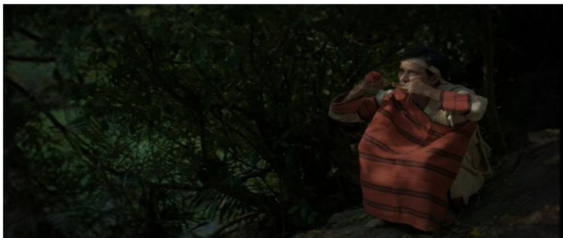
圖十五 口簧琴示範教學