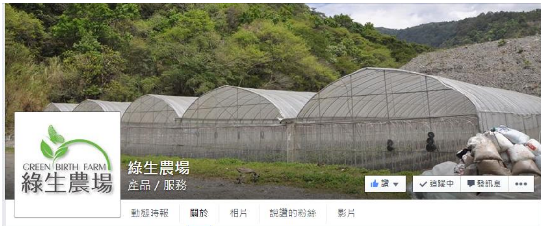
圖十八 綠生農場 facebook 封面

https://www.facebook.com/pages/%E7%B6%A0%E7%94%9F%E8%BE%B2%E5%A0%B4/121203877959514?sk=info&tab=page_info