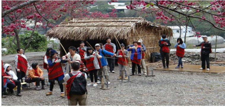
圖六 嚕咪谷射箭體驗