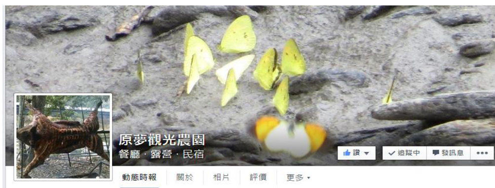
圖一 原夢觀光農園 facebook 封面