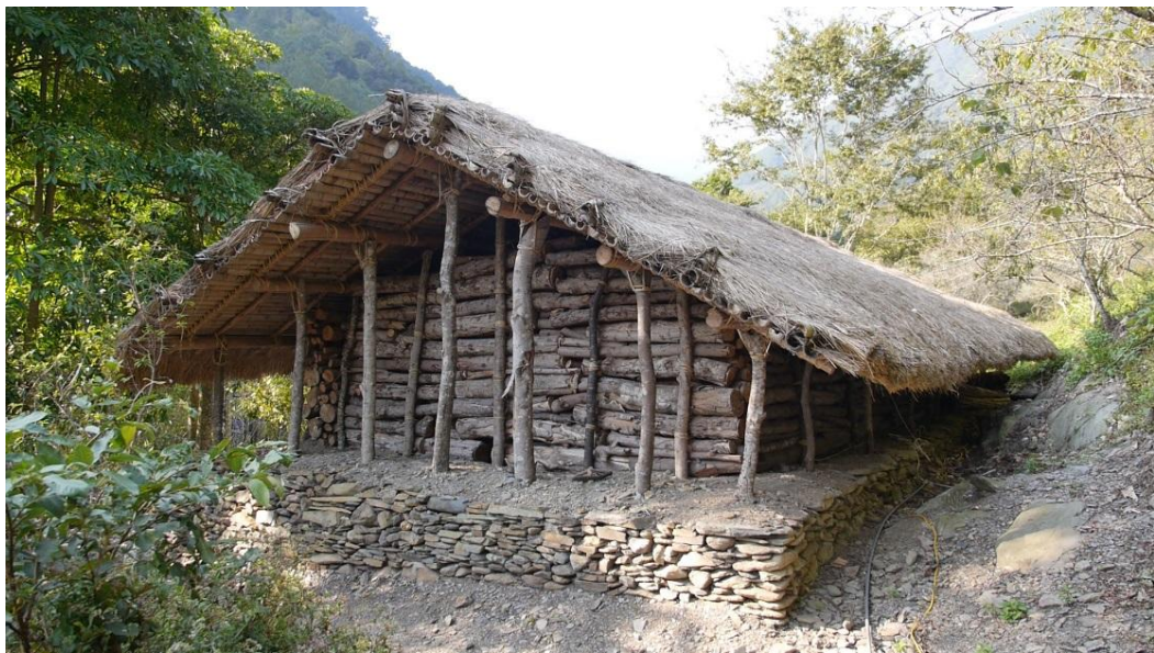
圖十三 賽德克族傳統家屋外觀

賽德克族多居住於高山地區，依山而居，所以多以半穴居為主，傳統家屋有著賽德克傳統智慧，建材天然、室內溫度調控、防禦功能、防災，屋子以原木堆疊而成，原木與原木間並非完全緊密有間隙，可以使屋裡生火的煙霧散出通風，更可以做為防衛用途，當敵人來襲，可以立即察覺反擊。