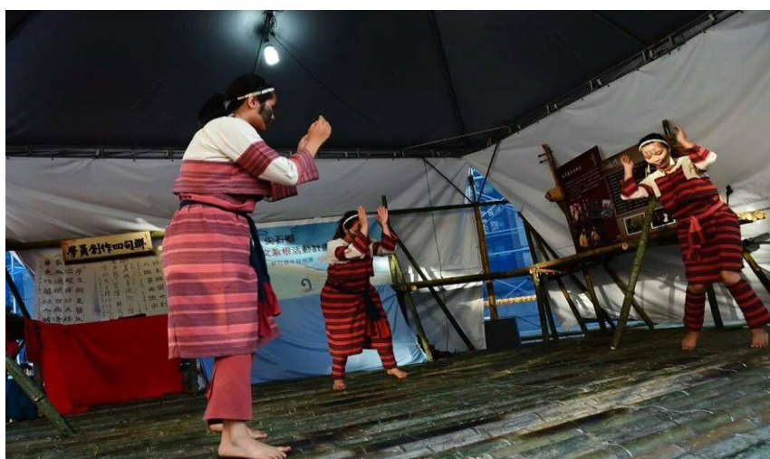
圖二十 源薪文化藝術工作室表演實況

源薪文化藝術工作室秉持著傳承賽德克傳統音樂舞蹈的精神，身體力行實踐著老人家的步伐，將傳統歌舞蘊含的豐富文化，透過音樂及表演的展現讓文化得到延續。致力於原住民傳統音樂、舞蹈與樂器的傳承與開創，希望能藉由創作與演繹帶給大眾熟悉卻全新的感受，一方面保持消失中的傳統原住民文化藝術，一方面弘揚台灣部落文化之美。