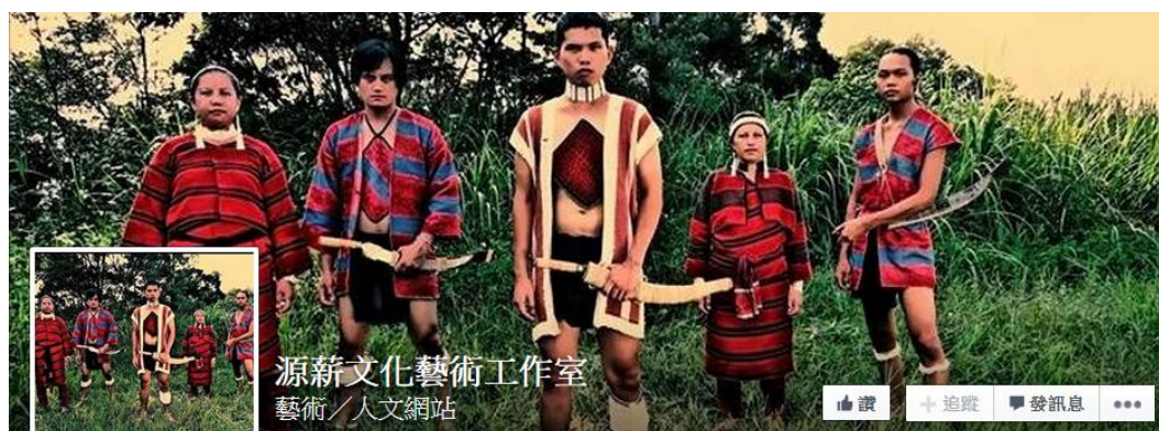
圖十九 源薪文化藝術工作室 facebook 封面