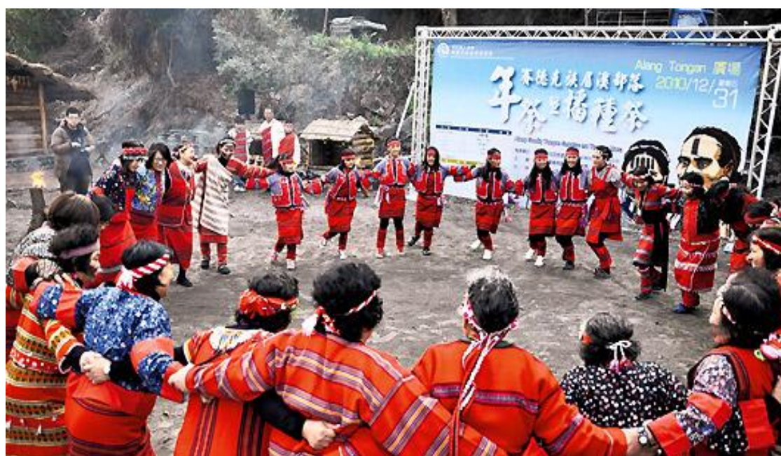
圖二十一 眉溪部落年祭活動實況

行銷策略包含透過與行政院原住民族委員會、南投縣政府、仁愛鄉農會、各級學校團體或各相關單位所舉辦之部落旅遊活動，打開眉溪部落的知名度，以及透過公部門資源使在地觀光發展。以及得以搭配賽德克族每年年底所舉行的傳統年祭活動，讓更多旅客知悉賽德克族文化與祭儀，透過年祭，吸引更多旅客前往眉溪部落進行深度旅遊。