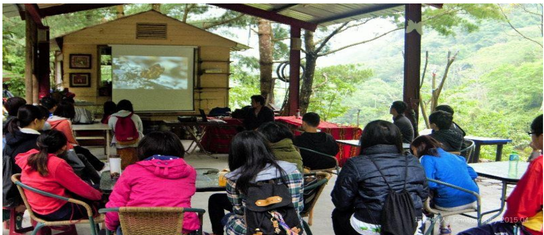
圖十四 遊客欣賞眉溪蝴蝶紀錄片實況