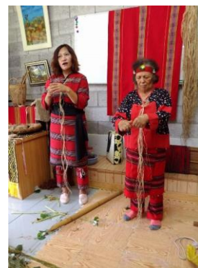
圖十一、圖十二 賽德克族傳統編織體驗