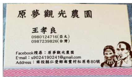
圖三 原夢觀光農園負責人