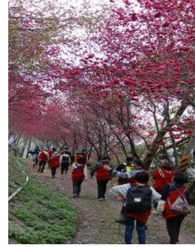
圖七 嚕咪谷櫻花林道

嚕咪谷露營區是由飾演「賽德克巴萊」電影中，莫那魯道二兒子的「巴索莫那」所開設的。本身家族兩代都是傳統獵人的老闆，自從拍攝完電影之後，就更對於推廣傳統文化覺得重要，因此回鄉開設露營區，並且帶著前來住宿的遊人深度體驗賽德克傳統射箭與狩獵。此外，園區中還種植了相當規模的櫻花林，每逢春節時分，都吸引相當多的遊客前來賞花，彷彿來到了日本，人人都能沉浸在櫻花紛飛的夢幻國度中。