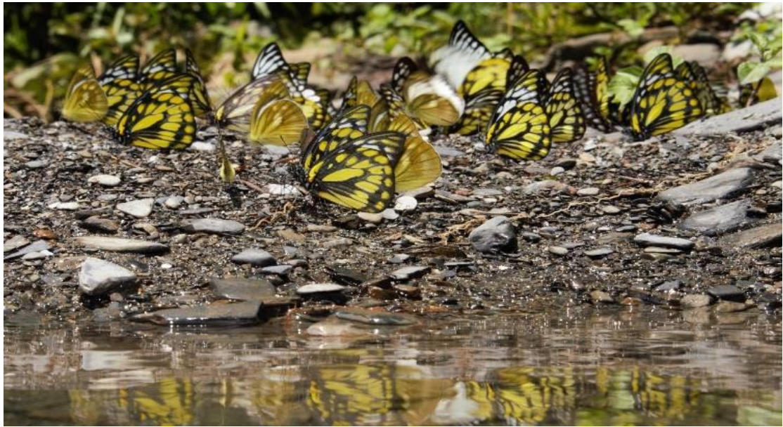
圖十六 蝴蝶生態實景

眉溪部落擁有豐富自然資源，豐富的蝴蝶品種，秋紅楓葉、梅櫻桃李等各種美麗的花紛紛在春季綻放，隨著季節的改變，美麗的山林也會有其不同樣貌。南山溪的夢谷與高雄的黃蝶翠谷、紫蝶幽谷並稱為台灣三大蝴蝶谷，眉溪部落又美稱為蝴蝶王國，台灣 410 種蝴蝶品種中，南山溪就有了 120 種，故不僅當蝴蝶數量豐富，品種更是多樣，故過去曾經出現盜捕濫捕的狀況發生，使得蝴蝶生態受到破壞，而在地人自主性地發起維護蝴蝶生態的願旨，成立了璞拉蕾蝴蝶班導覽。