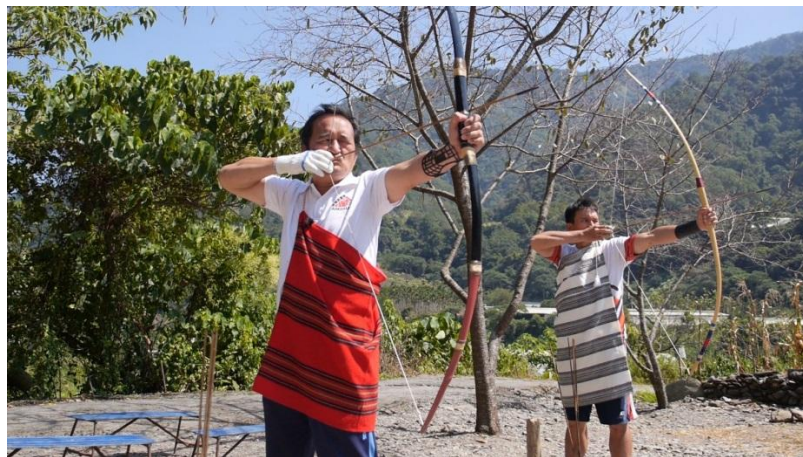
圖十 賽德克族傳統射箭體驗