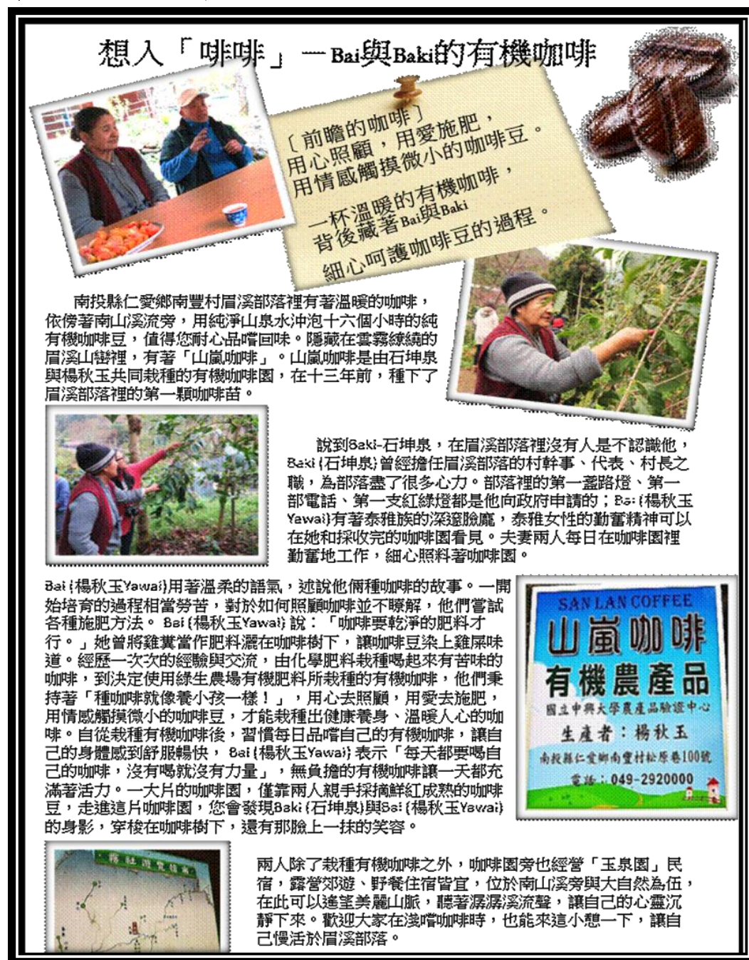
圖十七 石媽媽咖啡介紹