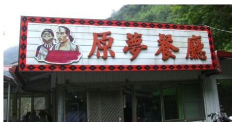
圖二 原夢觀光農園餐廳外觀