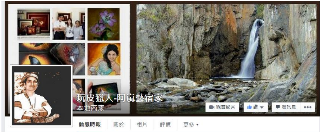
圖十四 玩皮獵人 facebook 封面