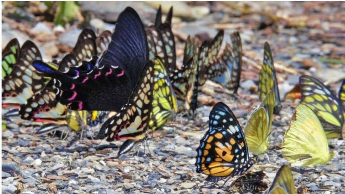
圖十六 蝴蝶種類之多樣性

眉溪部落擁有豐富自然資源，豐富的蝴蝶品種，秋紅楓葉、梅櫻桃李等各種美麗的花紛紛在春季綻放，隨著季節的改變，美麗的山林也會有其不同樣貌。南山溪的夢谷與高雄的黃蝶翠谷、紫蝶幽谷並稱為台灣三大蝴蝶谷，眉溪部落又美稱為蝴蝶王國，台灣 410 種蝴蝶品種中，南山溪就有了 120 種，故不僅當蝴蝶數量豐富，品種更是多樣，故過去曾經出現盜捕濫捕的狀況發生，使得蝴蝶生態受到破壞，而在地人自主性地發起維護蝴蝶生態的願旨，成立了璞拉蕾蝴蝶班導覽。