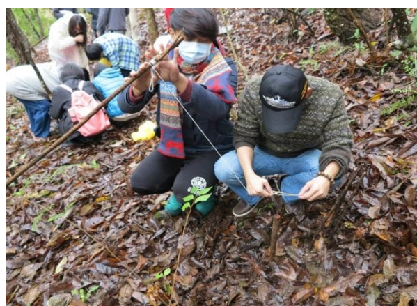
圖六、圖七 賽德克族傳統陷阱示範