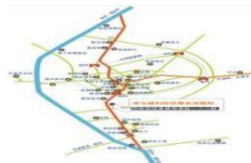
(圖八)旅遊醫院位置圖