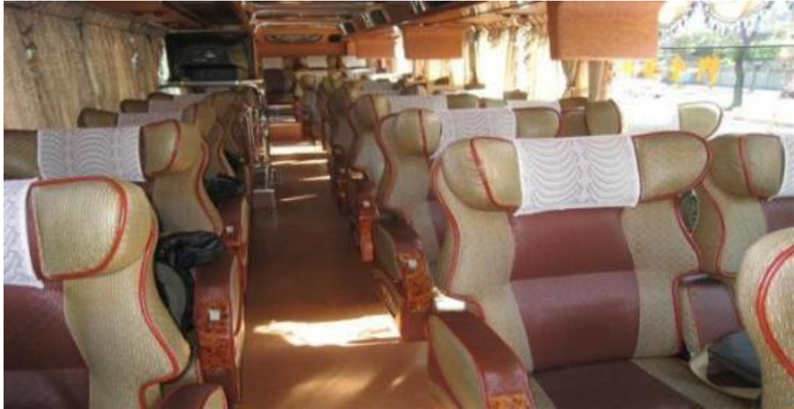
(圖十)遊覽車車上圖

我們所使用的是三排椅，讓每個遊客能在 3 天 2 夜的旅程中，在遊覽車上面也能享受到舒服的空間，而且不會太過於壅擠在遊覽車上也能擁有自己的小小空間。