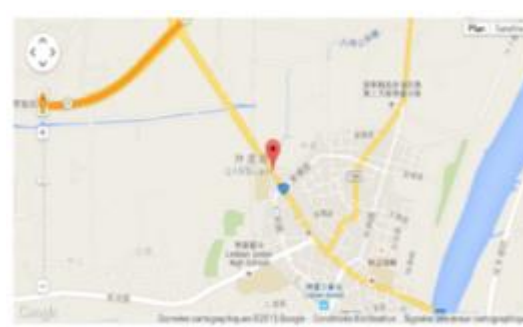
(圖九)小康醫院位置圖