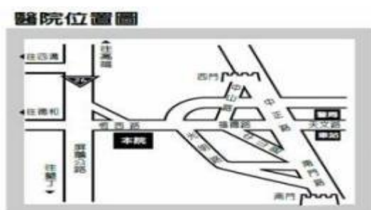
(圖六)基督教醫院位置圖