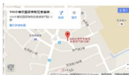
(圖七)南門醫院位置圖