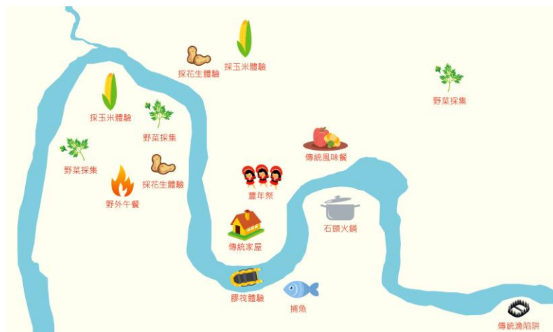
圖 2 奇美部落路線規劃圖