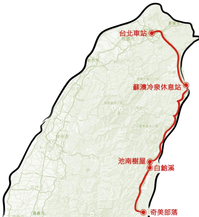
圖 1 路線規劃圖