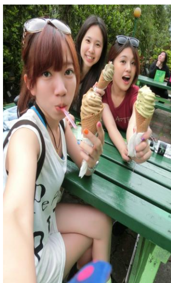
貓茶町來支鐵觀音冰淇淋消暑