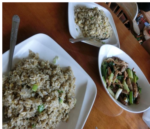
中午吃阿義師有淡淡茶香味料理