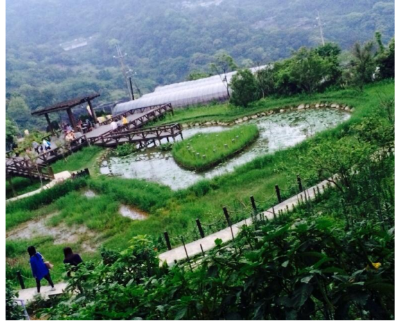
往裡走看到同心池，這裡空氣好好