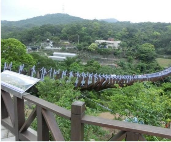
來走白石湖吊橋風景好美