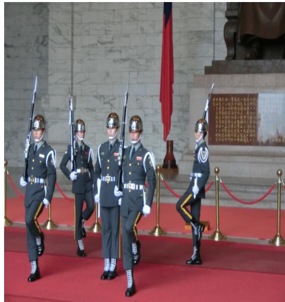
欣賞衛兵交接氣勢磅礴