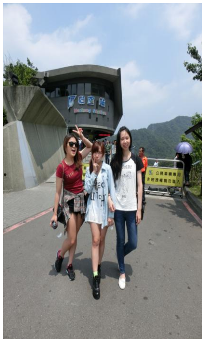
搭纜車上貓空樓還坐到了KITTY彩繪專車