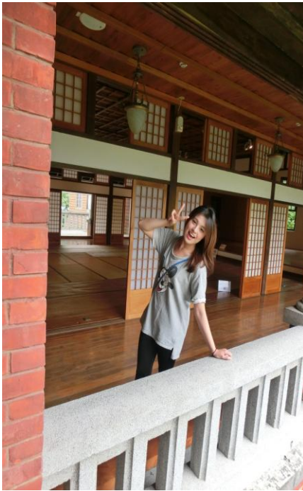
參觀溫泉博物館，日式建築一覽無遺