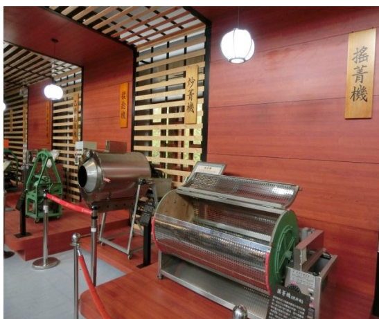
參觀茶推廣中心、試喝鐵觀音